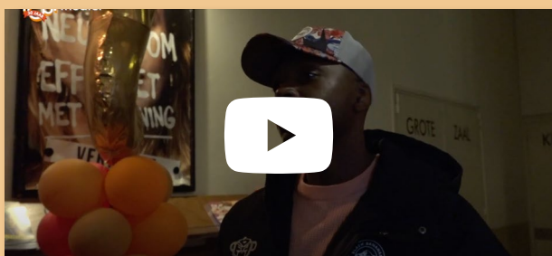
"Ik heb hier kunnen groeien"