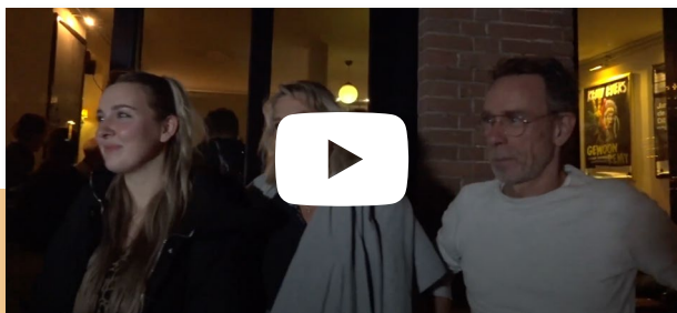
"Dicht op het podium"