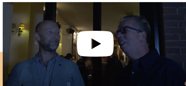
"Leuk om minder bekende artiesten te zien"